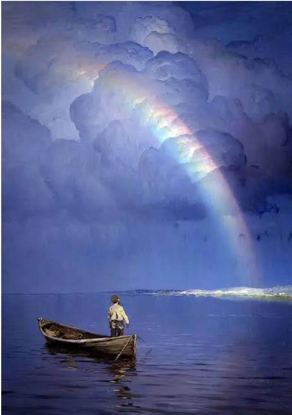
Nikolaj Nikanorovich Dubovskoj – pittore russo (1859-1918) – l'Arcobaleno