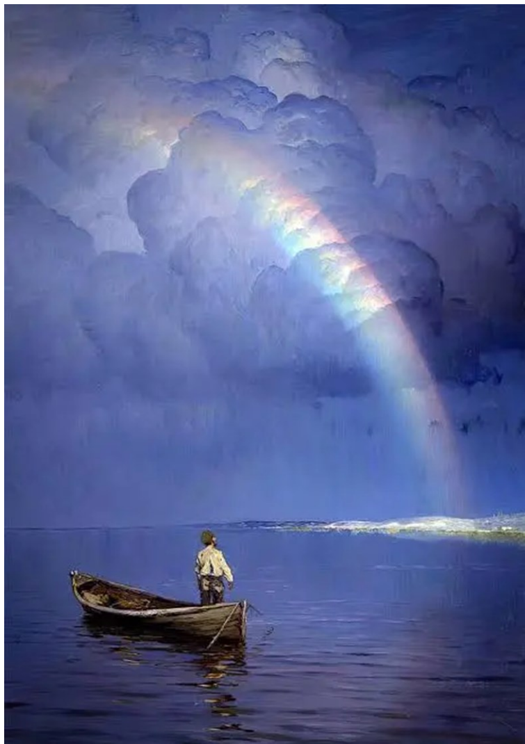
Nikolaj Nikanorovich Dubovskoj – pittore russo (1859-1918) – l'Arcobaleno

DOMENICA 5 APRILE PASQUA DI RISURREZIONE